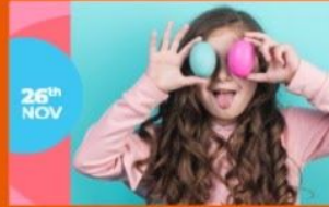
TUTORIAL CREATIVOS EN 3,2,1 para chicos inquietos